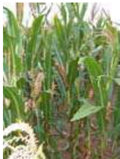
Izquierda con Lithovit®, derecha control.