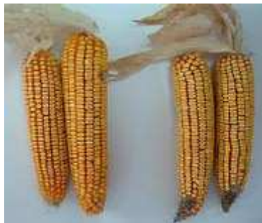
Izquierda con Lithovit®, derecha control.