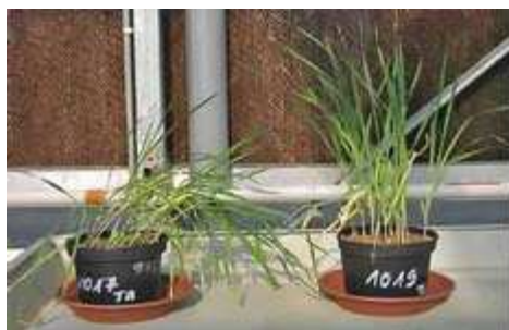
Cebada: izquierda sin tratamiento y derecha con Lithovit®.

Granos de Invierno y Verano: cuando aparece la última hoja.