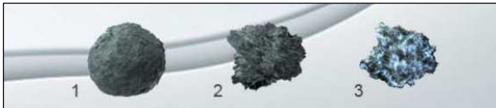
Activación Tribodinámica (TDA), cambia la superficie de las partículas de forma efectiva: 1. molienda clásica 2. Molienda jet (opuesta) 3. Molienda tribodinámica.

Lithovit ® es la última innovación en el campo de TDA, (modelo de utilidad registrado con la Oficina Alemana de Patentes y Marcas). Es el primer fertilizante natural de CO2 para uso en todo tipo de cultivos, puede ser aplicado en silvicultura, agricultura, jardines con excelentes resultados.